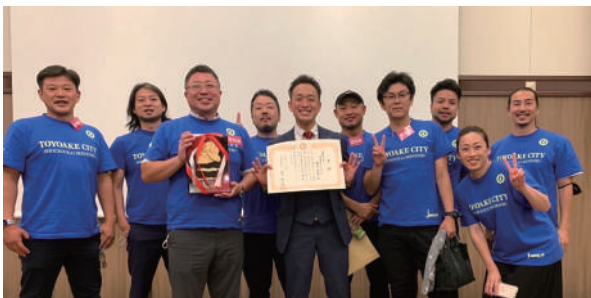
8月17日に開催された主張発表大会の中部ブロック大会にて。見事最優秀賞に輝き、熊本にて行われた全国大会への切符を手に入れました。