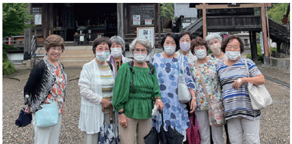
7月4日の役員研修にて。写真は関善光寺。この後犬山城下町を散策しました。